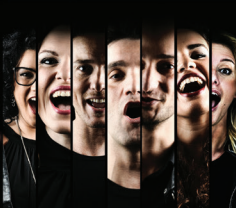
WAKEUP GOSPEL PROJECT